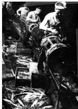
ドラム巻き式漁具でのイカ釣り 昭和30年代