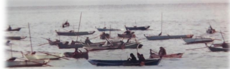
泊漁港付近でのアワビ漁の様子（カッコ船）