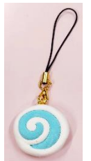
クジラ餅ストラップ