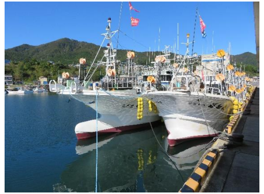
焼山漁港とイカ釣り船