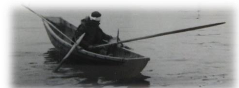
丸木舟でのアワビ漁