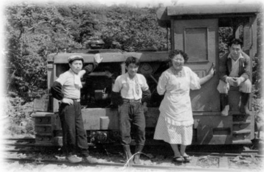
内燃機関車の前で

昭和10年から39年まで、老部川沿いに森林鉄道の機関車が約9kmの区間、天然ヒバ材を運んでいました。軌道跡の林道を自然観察しながら散策します。六ヶ所村の歴史や豊かな自然を体感しましょう！