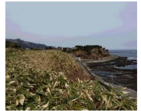
館の上御番所地形の図 館の上御番所から中山崎を望む