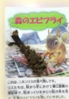
【6~7問正解】森のエビフライ