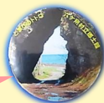
【全問正解】缶バッジ